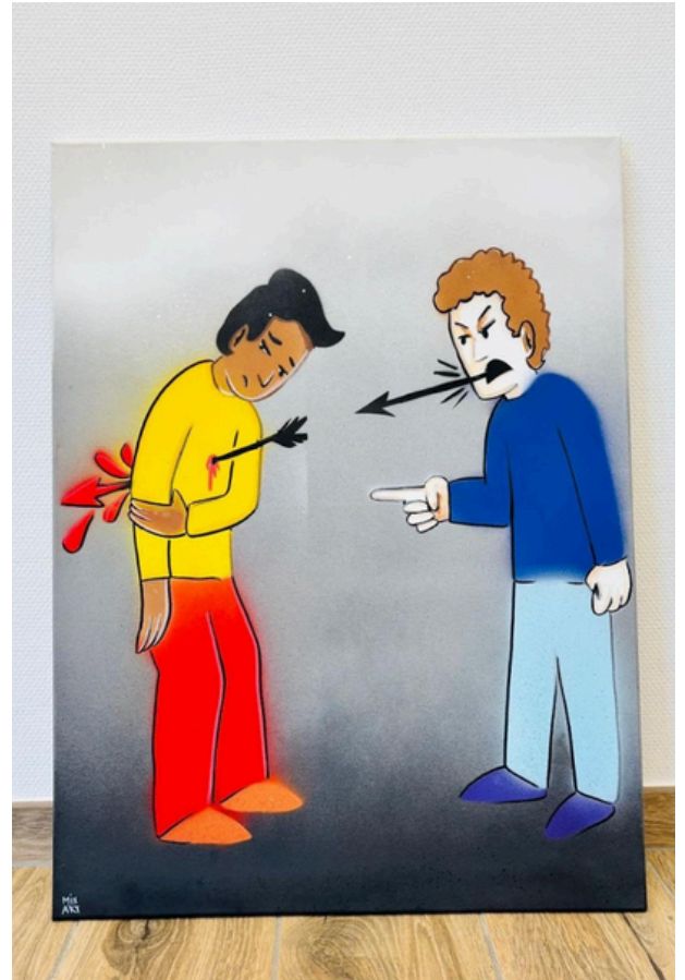
Exemples d'une oeuvre réalisée par les jeunes du CEF du Marquisat

Responsable du programme "Droits devant Toi"